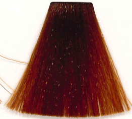
7/4 RUBIO MEDIO COBRIZO MEDIUM COPPER BLONDE