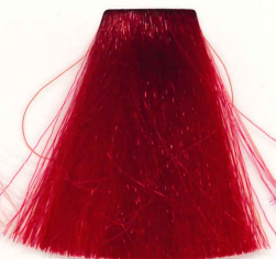
ROJO ARDIENTE BURNING RED