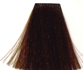
6/38 RUBIO OSCURO MARRÓN DORADO DARK GOLDEN BRUNETTE BLONDE