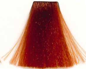
8/4 RUBIO CLARO COBRIZO LIGHT COPPER BLONDE