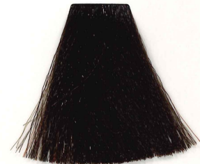
4/18 CASTAÑO MEDIO CENIZA MARRÓN EDIMUM ASH BRUNETTE BROWN