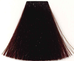
5/53 CASTAÑO CLARO CAOBA DORADO LT. GOLDEN MAHOGANY CHESTNUT