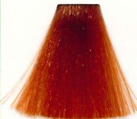
NARANJA SPANISH ORANGE