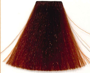
6/4 RUBIO OSCURO COBRIZO DARK COOPER BLONDE