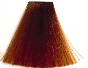
7/43 RUBIO MEDIO COBRE DORADO MEDIUM COPPER GOLD BLONDE