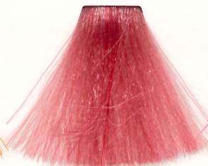
PANTERA ROSA PINK PANTER