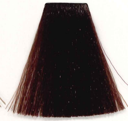
7/53 RUBIO MEDIO CAOBA DORADO M. GOLDEN MAHOGANY BLONDE