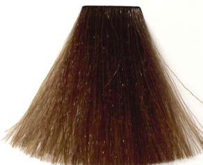
8/18 RUBIO CLARO CENIZA MARRÓN LIGHT ASH BRUNETTE BLONDE