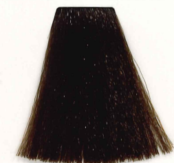
6/23 RUBIO OSCURO IRISADO DORADO DARK PEARL GOLDEN BLONDE