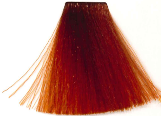
7/44 RUBIO MEDIO COBRE INTENSO MEDIUM INT. COPPER BLONDE