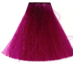
AMO EL VIOLETA I LOVE VIOLET