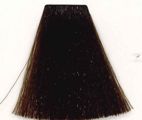
5/23 CASTAÑO CLARO IRISADO DORADO LIGHT PEARL GOLDEN BROWN