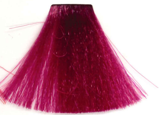
CICLAMEN REAL REAL CYCLAMEN