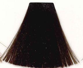
4/23 CASTAÑO MEDIO IRISADO DORADO MEDIUM PEARL GOLDEN BROWN