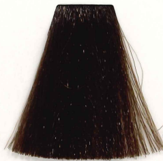
6/18 RUBIO OSCURO CENIZA MARRÓN DARK ASH BRUNETTE BLONDE