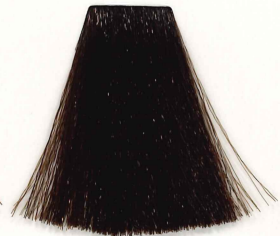
5/18 CASTAÑO CLARO CENIZA MARRÓN LIGHT ASH BRUNETTE BROWN