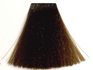
7/23 RUBIO MEDIO IRISADO DORADO MEDIUM PEARL GOLDEN BLONDE