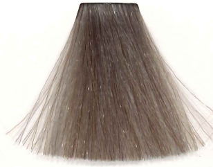
RUBIO HIELO ICY BLONDE