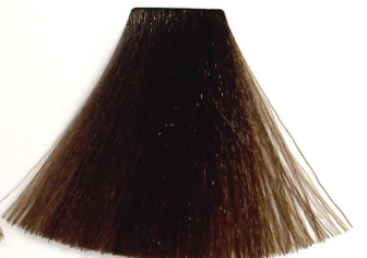
7/18 RUBIO MEDIO CENIZA MARRÓN MEDIUM ASH BROWN BLONDE