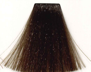
7/81 RUBIO MEDIO MARRÓN CENIZA MEDIUM ASH BROWN BLONDE